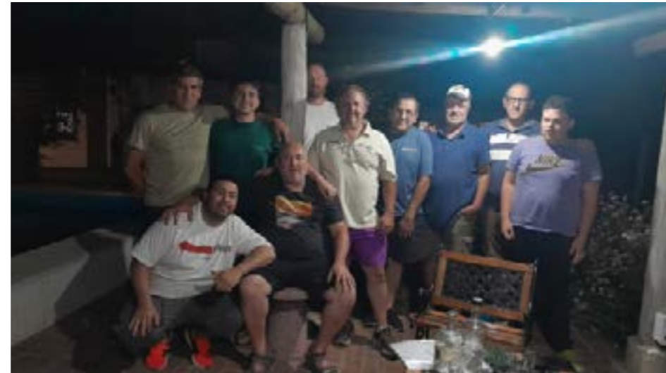
En los próximos días comenzará el trabajo activo en cada una de las áreas, dando forma a una agenda que permita encarar el 2026 con objetivos claros y una planificación acorde a las necesidades del club y del automovilismo regional.

al Auto Moto Club Nuevejuliense y proyectar un crecimiento sostenido tanto en lo deportivo como en lo institucional. En los próximos días comenzará el trabajo activo en cada una de las áreas, dando forma a una agenda que permita encarar el 2026 con objetivos claros y una planificación acorde a las necesidades del club y del automovilismo regional.