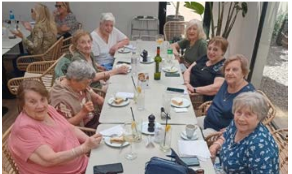
celebraron siete décadas de trayectoria y amistad.