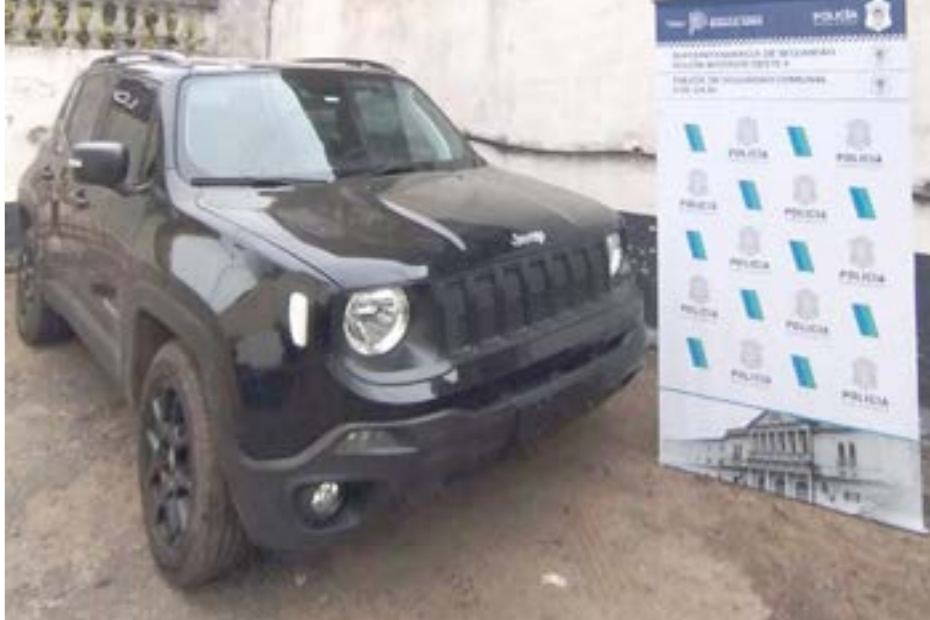
Se labraron actuaciones penales con la carátula “Encubrimiento y Desobediencia”, con intervención del Departamento Judicial de Mercedes. El vehículo fue depositado en el depósito judicial y el aprehendido quedó a disposición del Magistrate de Intervención.

Personal policial interceptó en la intersección de calles Ramón N. Poratti y Robbio un vehículo tipo pick-up marca Jeep, modelo Renegade, color negro, conducido por un vecino de esta localidad. Tras la correspondiente inspección de la documentación, se estableció mediante el sistema informático policial que el rodado tenía una “Prohibición de Circular”, disposición de la cual su propietario tenía conocimiento, pero hizo caso omiso. En consecuencia, se procedió al secuestro del vehículo y a la aprehensión del conductor.