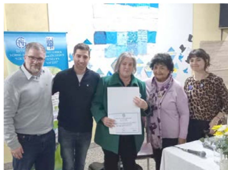
estos asuntos se renueven en el plano de las ciencias sociales y humanas, ahí los compromisos son mayores".

Además, agregó: "La educación pública crea y gestiona conocimiento. Y la malla patriarcal es propia al conocimiento normal y estandarizado. Es necesario revisarlo, hacer una interpelación profunda a todos los conocimientos, algo ya se está haciendo. Es más fácil que