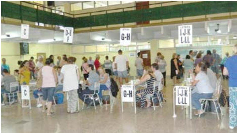
Los comicios de la CEyS "Mariano Moreno" se realizarán el 16 de marzo. Las listas de candidatos a delegados podrán presentarse hasta hoy,

viernes 14 de febrero. El 16 de marzo, la Cooperativa Eléctrica y de Servicios "Mariano Moreno" de 9 de Julio realizará sus elecciones de delegados para los distritos Norte, Sur, Este y Oeste. REQUISITOS PARA SER DELEGADO