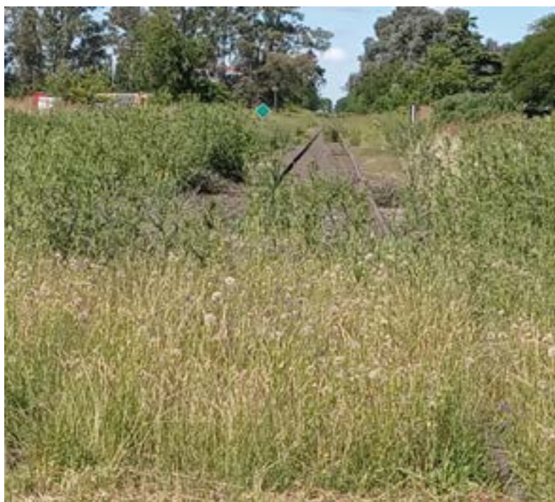
La imagen vale por mil palabras. Y esta exhibe solo abandono y pastizales desde que dejó de pasar el tren por nuestra ciudad ...