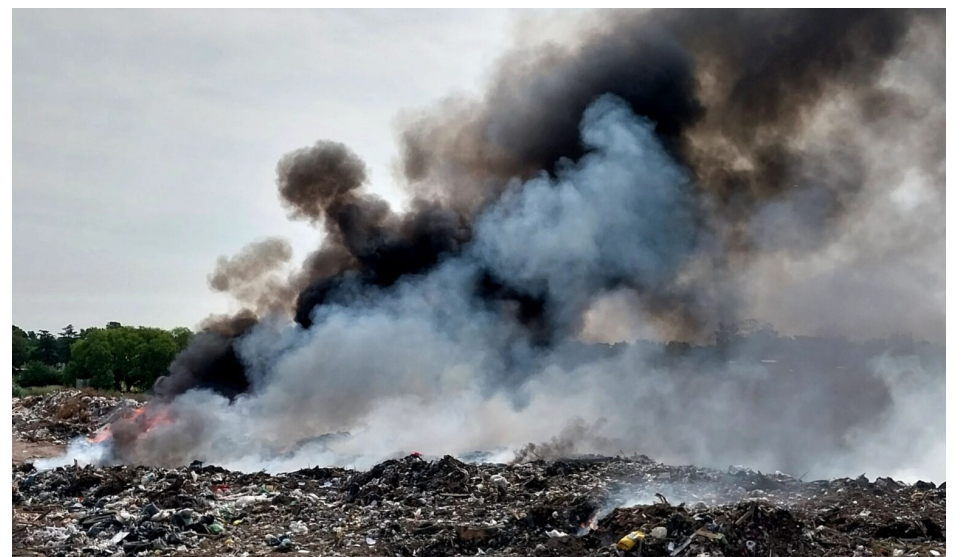
la exposición personal al humo y a las cenizas.

En caso de tener que permanecer al aire libre durante períodos prolongados en momentos de humo intenso debido al trabajo u otros factores, se recomienda, el uso de mascarillas adecuadas que se ajusten bien a la cara. De esa manera se logra reducir