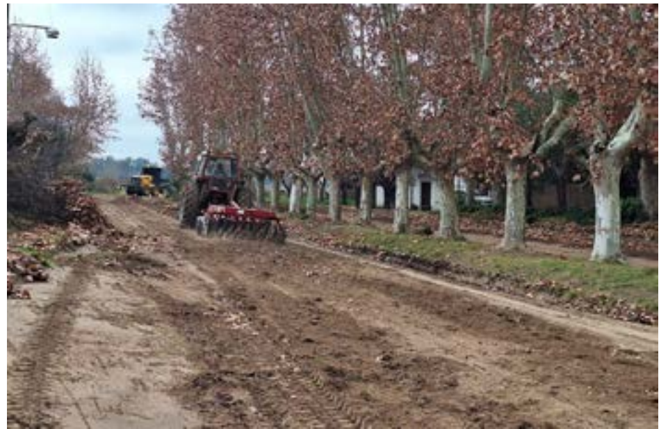
Vista de los trabajos en la localidad de French