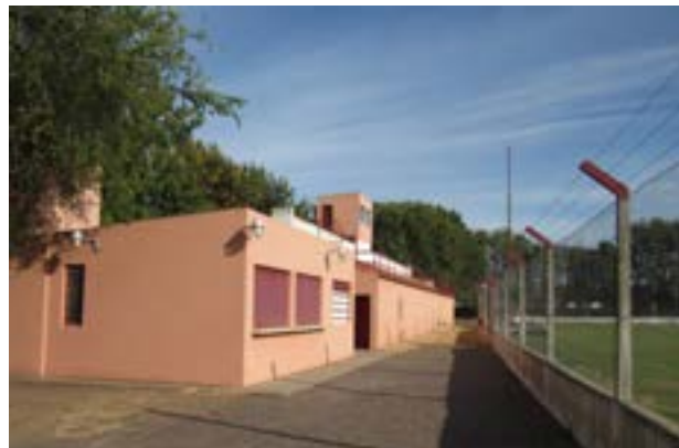
esta gran familia roja. ¡Feliz Aniversario!!!

sus destinos con visión y determinación. Mientras celebramos este hito significativo en la historia del club, miramos hacia el futuro con optimismo y determinación. El Club y Biblioteca Agustín Álvarez sigue siendo un faro de esperanza y un símbolo de unidad en tiempos de adversidad. Que los próximos 95 años estén llenos de éxitos, logros y momentos inolvidables para todos los que forman parte de