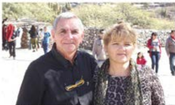
Conduce: Héctor Rodolfo Tinetti Cámaras: Micaela María Petetta