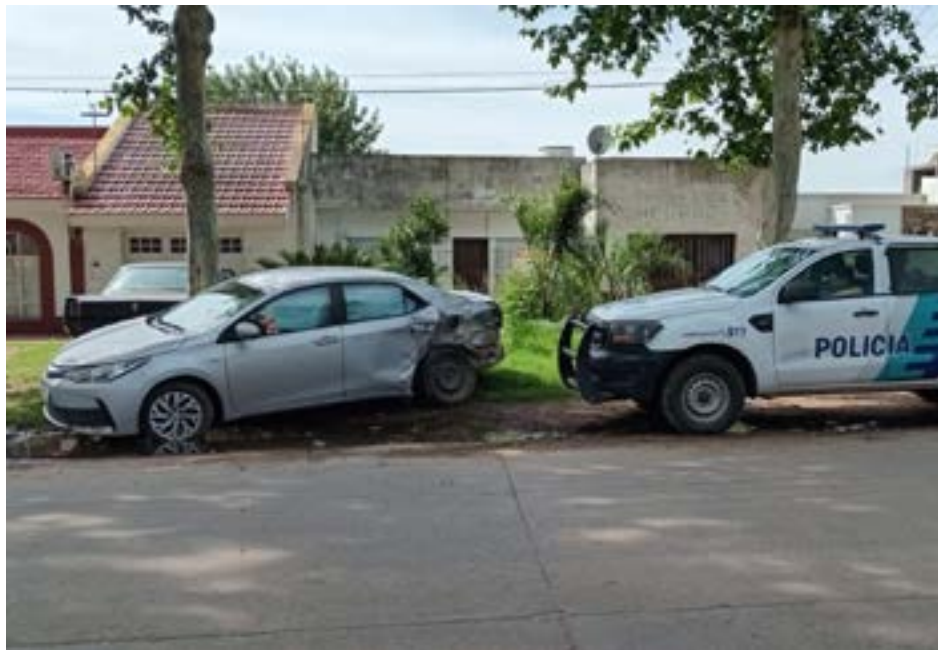
Un violento accidente ocurrió el sábado alrededor de las 15:30 en 25 de Mayo y Compairé. Una chata Ford Raptor y un auto Toyota colisionaron. Los dos conductores fueron trasladados por Clysa al hospital local Julio de Vedia.