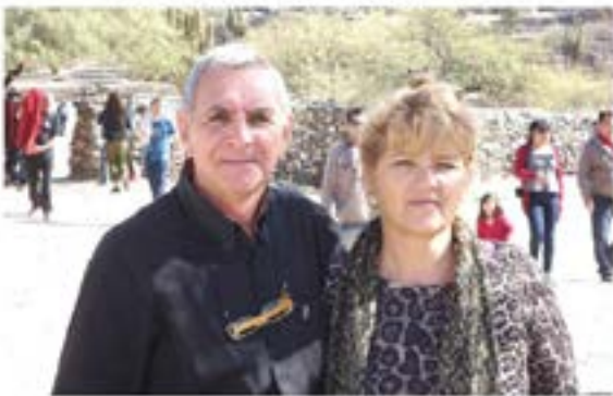
Conduce: Héctor Rodolfo Tinetti Cámaras: Micaela María Petetta