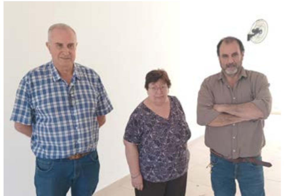
de diciembre -con cupos limitados-, sabiendo de la trayectoria de 36 años en la comunidad del Hogar.

Asimismo, invitó a los interesados a inscribir a sus niños, hasta el día 20