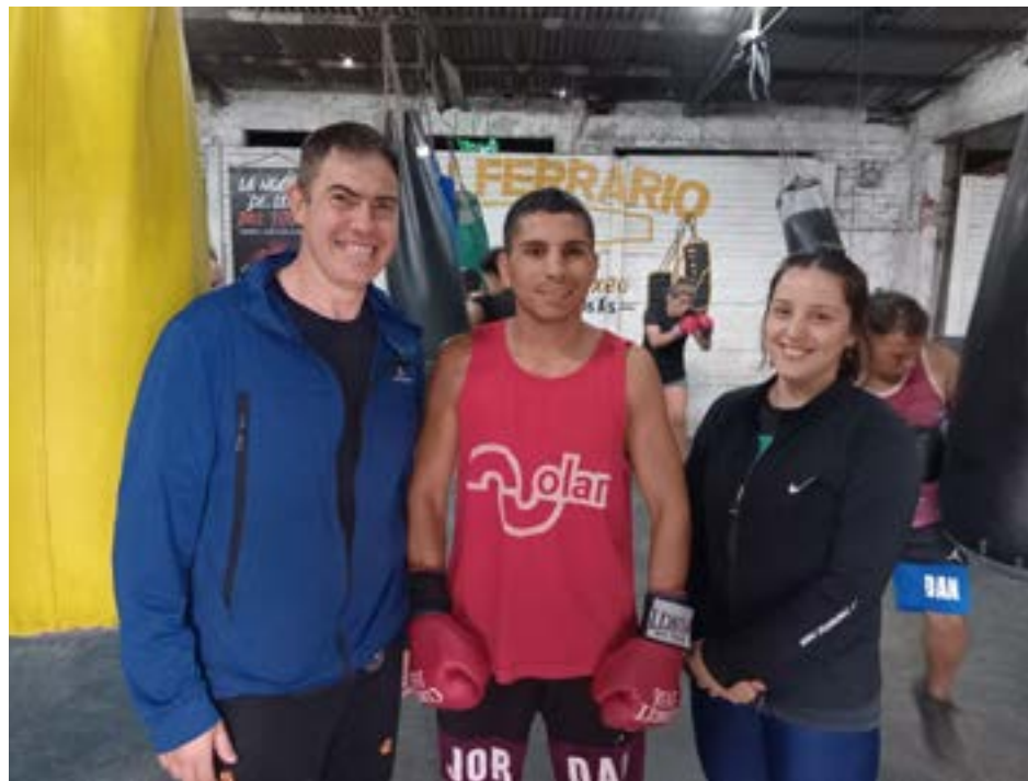
Beotegui, a diario "Tiempo".

"Los chicos del gimnasio están entrenando muy bien y recuperados de sus lesiones, por lo que aceleramos los entrenamientos hasta días previos a las peleas, donde enfrentarán a muy buenos rivales, con buenos anteceden-