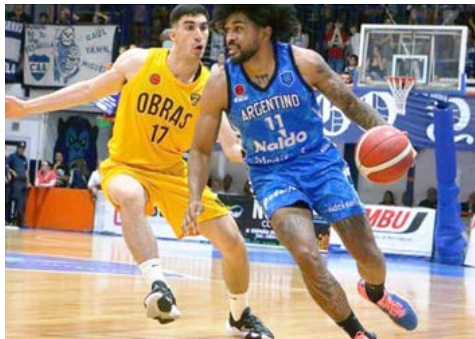
Partido de Basquet profesional preparatorio para el torneo de la Liga Nacional, se juega el miércoles 27 en Atlético