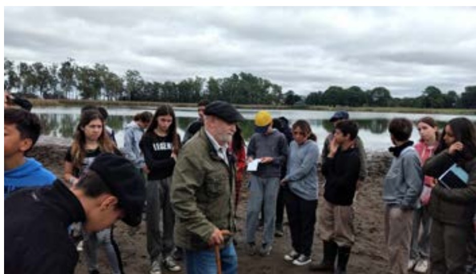
En el marco del Proyecto "Museo a las Escuelas", la dirección de Museos, Archivo Histórico y Turismo, junto a docentes y alumnos de la Escuela

Agropecuaria M.C. y M.L. Inchausti, dependiente de la Universidad Nacional de La Plata, trabajan sobre la historia del lugar, en especial sobre el fortín "Cruz de Guerra".