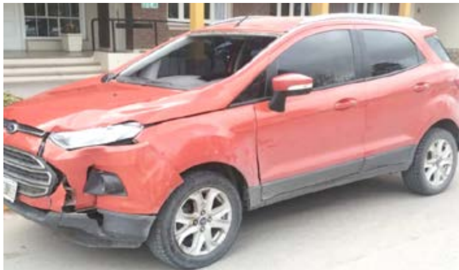
Foto proporcionada por la Policía del presunto vehículo que habría impactado contra el joven y que le provocó la muerte.

La Policía aprehendió ayer a dos posibles imputados por la muerte de Matías Sebastián Inveninato, el joven de 37 años que fue arrollado en el acceso a la localidad de French el domingo pasado. Tras varias investigaciones, algunas de ellas encubiertas según informó la policía local, aprehendió a dos hombres mayores de edad en la localidad de San Cayetano (un distrito del sur de la provincia de Buenos Aires) y secuestró la camioneta que habría impactado fatalmente contra el joven. Los aprehendidos quedaron a disposición de la fiscalía N° 4 de Mercedes quienes durante las primeras horas