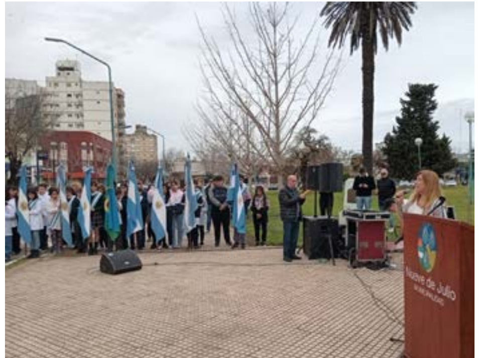
ofrenda floral en el busto de Domingo Faustino Sarmiento.

educación", y "donde se recuerda a todos los que hacen a la educación, como esas primeras personas que nos esperan en la escuela en puerta, que preparan el desayuno y mantienen todo limpio y todos puedan estar como se merecen en la escuela, como son los auxiliares; las secretarías y secretarios y los docentes". "Cada uno de ellos transita por nuestras aulas con pasión, con ganas a pesar de los problemas cotidianos, y hacen que esta vocación y este verdadero acto de servicio que es educar, no se pierda", remarcó. El acto finalizó con la colocación de una