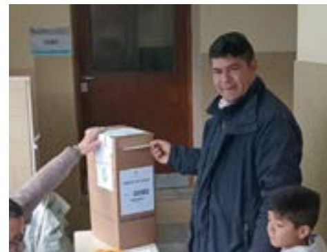
Imágenes de algunos precandidatos en el momento de emitir su voto y de distintas escenas de las votaciones de la jornada dominical