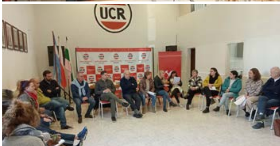
Imágenes del Comité Local, lugar en donde se presentaron los equipos de trabajo ante la prensa

destacar este trabajo conjunto de los equipos de la UCR, "elaborando diagnósticos muy claros para proyectar a futuro