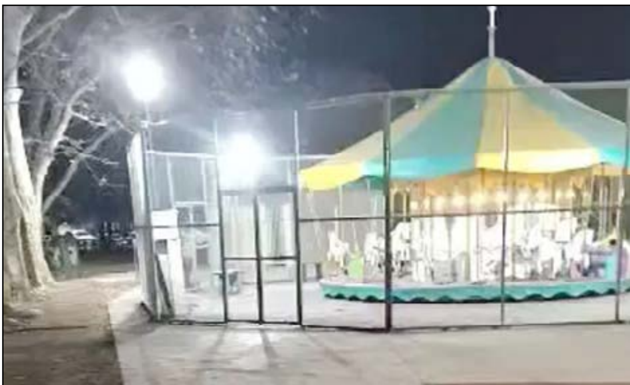
La tradicional calesita sufrió destrozos a pocas hora de la reinauguración del sector de juegos