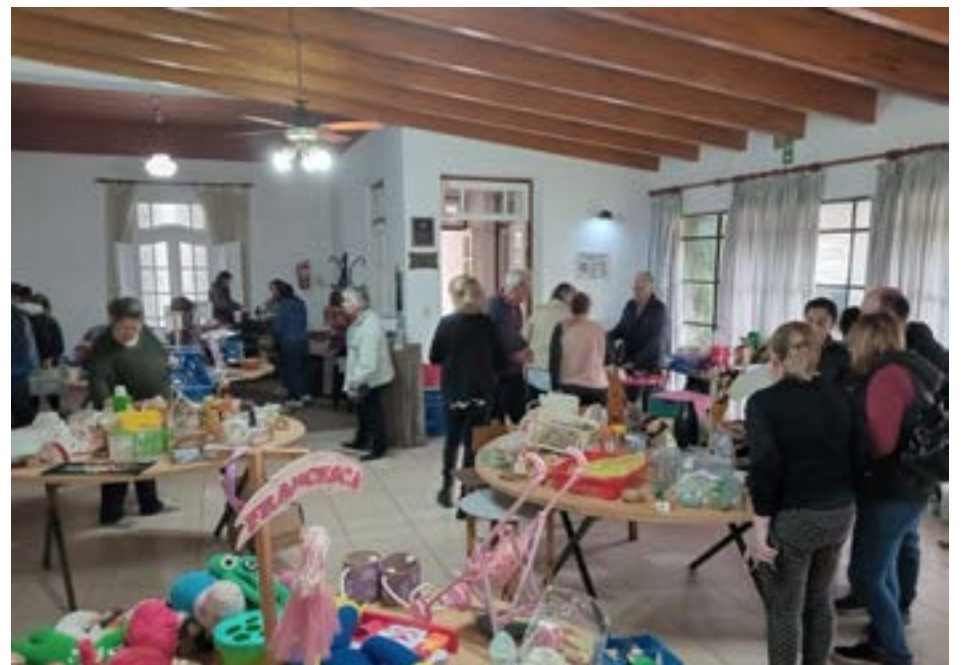
El Rotary Club de 9 de Julio, realizó la tradicional feria "Gran Barata". Se llevó a cabo en su sede ubicada en Arturo Fron-