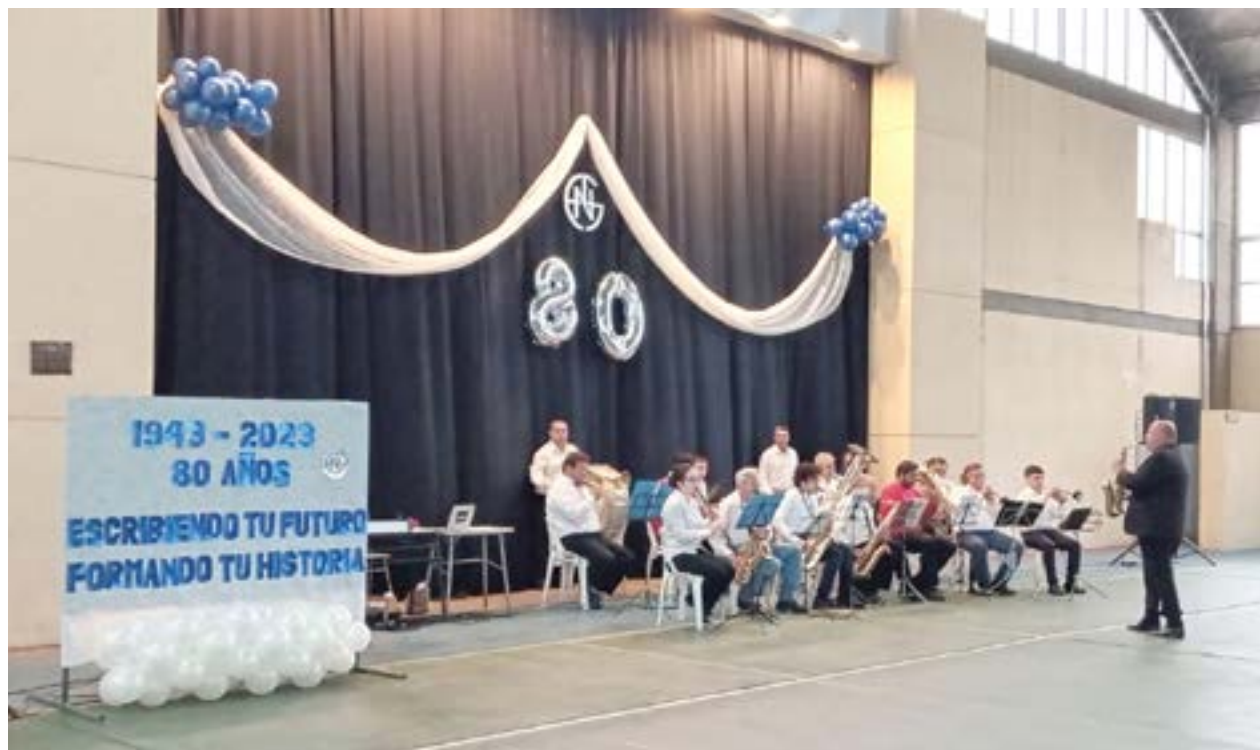
Bajo el lema "Escribiendo tu futuro, formando tu historia" una de las escuelas públicas más emblemáticas de la ciudad, conmemoró sus 80 años de vida institucional