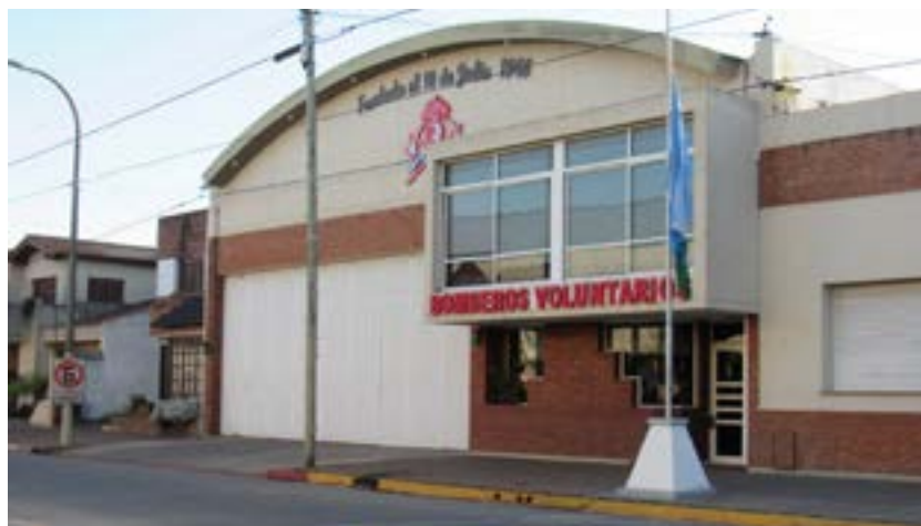
Fachada del edificio de la institución voluntaria

Esta instancia permitirá asumir los costos de reemplazo de baterías en una de las unidades