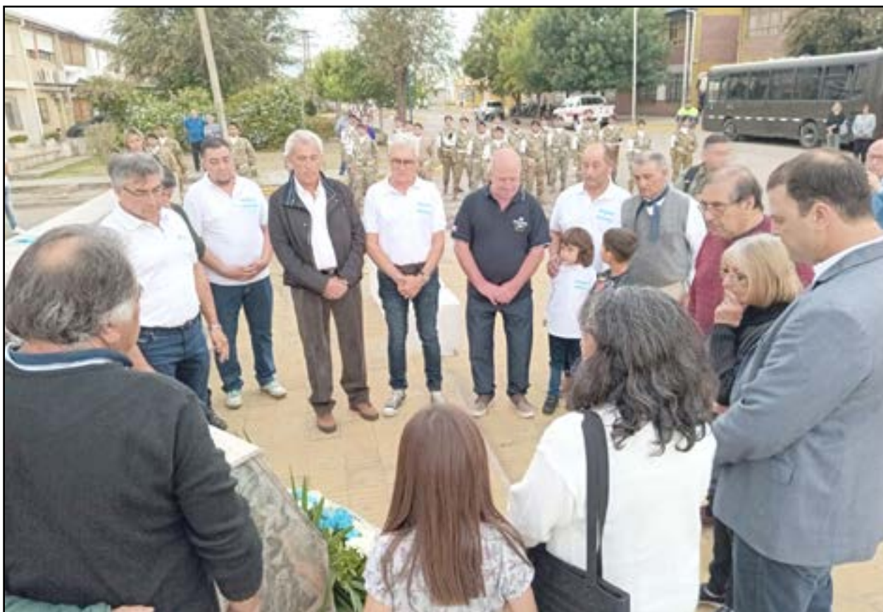
Los ex combatientes locales y las autoridades municipales en torno al monumento del Soldado Francisquez (Foto De Sogos).