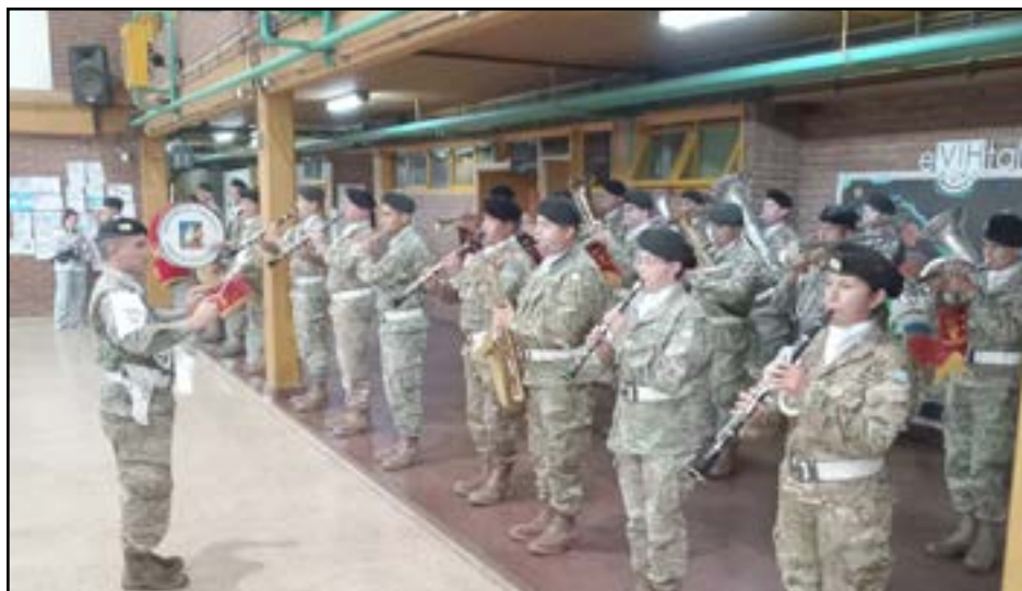
Soldados nuevejulienses que participaron en la gesta de Malvinas fueron homenajeados en la jornada de ayer en el acto realizado en la Escuela de Educación Secundaria Técnica N°2.

La Municipalidad desarrolló ayer -domingo 2 de abril-, los actos oficiales por el 41° aniversario del conflicto bélico y el Día del Veterano y los Caídos en la guerra de Malvinas.