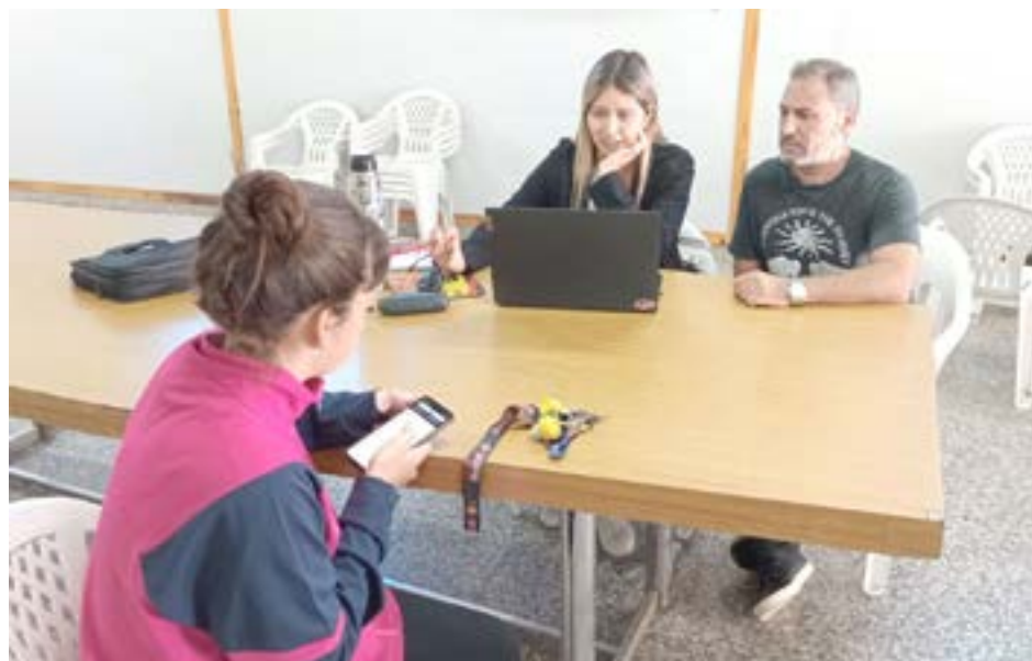
Integrantes de la UB "Juan Domingo Perón" junto a una joven realizan la inscripción al programa "Becas Progresar".