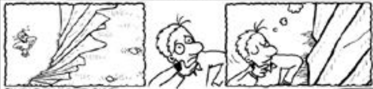
Cada uno cree lo que cree