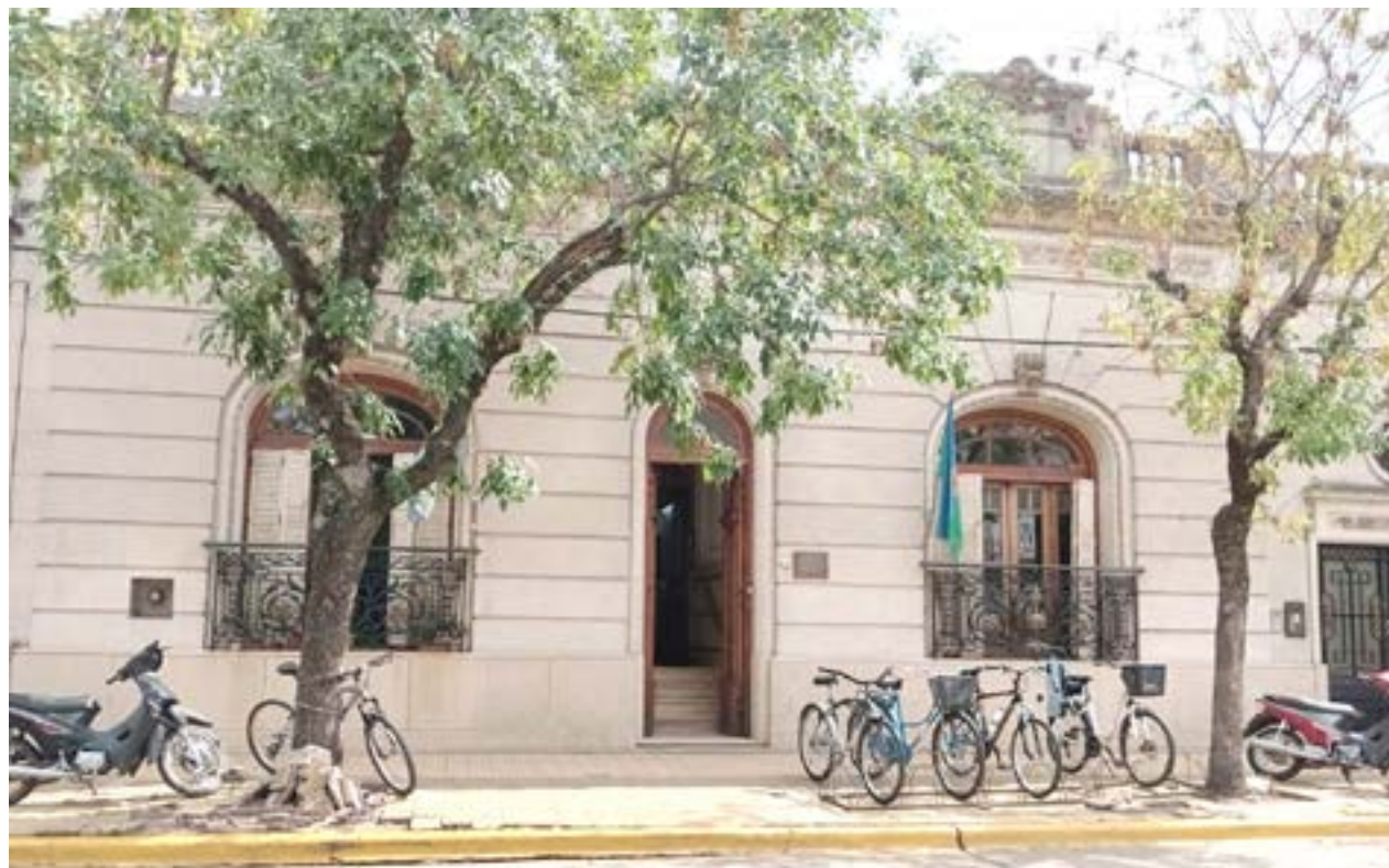
A partir de ayer, el Consejo Escolar funcionará con un consejero menos (Foto De Sogos).