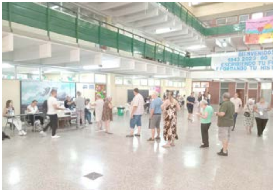
El hall central de la Escuela de Comercio fue el lugar elegido para las elecciones de la CEyS.