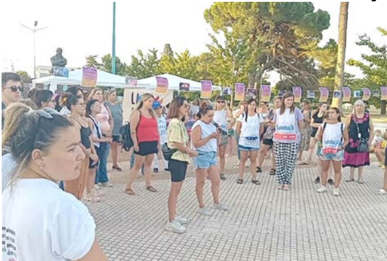
Pasaje de la jornada sobre los derechos de la mujer, realizada en pleno centro de la ciudad.