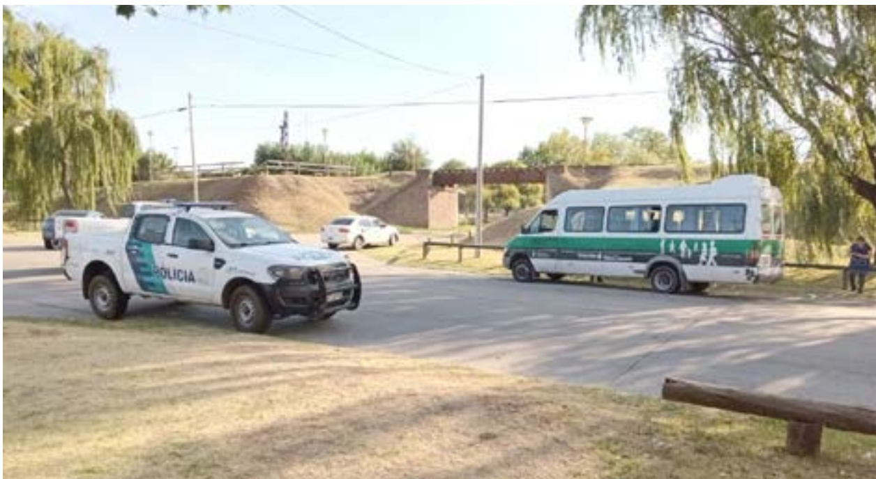
La imagen muestra donde, en la jornada de ayer, se registró el lamentable hecho donde perdiera la vida un vecino.