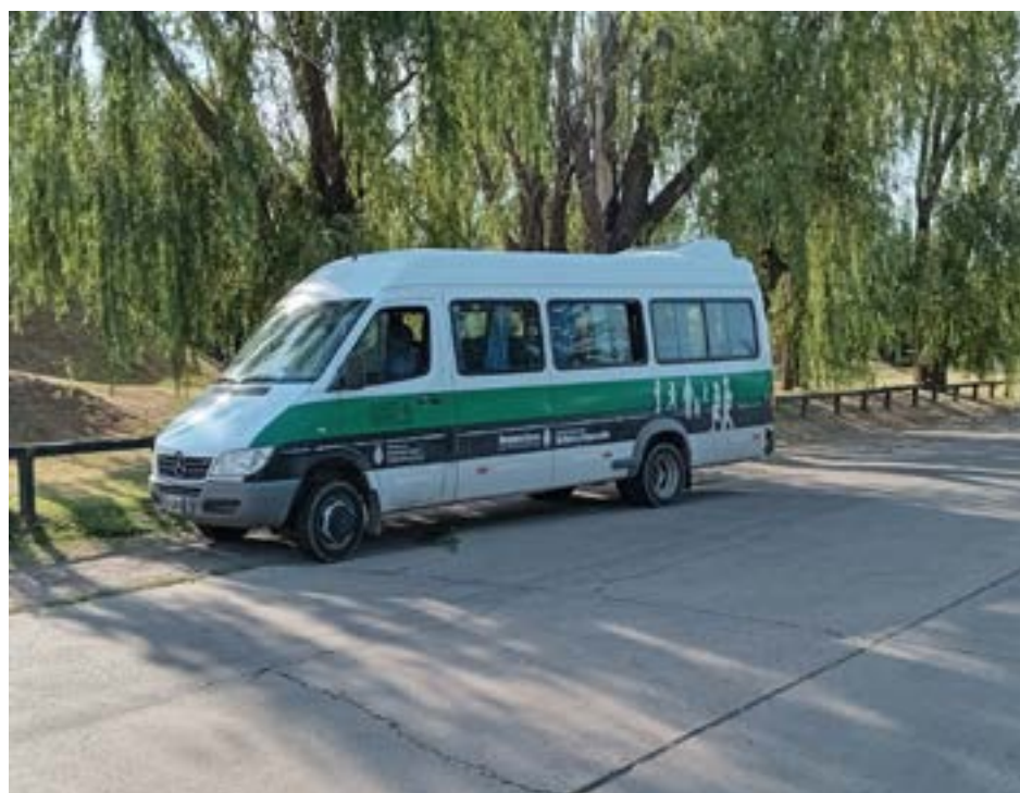
Unidad de transporte de alumnos de la Escuela N° 501 protagonista del fatal accidente.

En el lugar trabajó la Policía Científica de la ciudad de Mercedes, y se solicitaron imágenes de cámaras de seguridad municipales. Intervino en el hecho la UFI N° 3 de Mercedes.