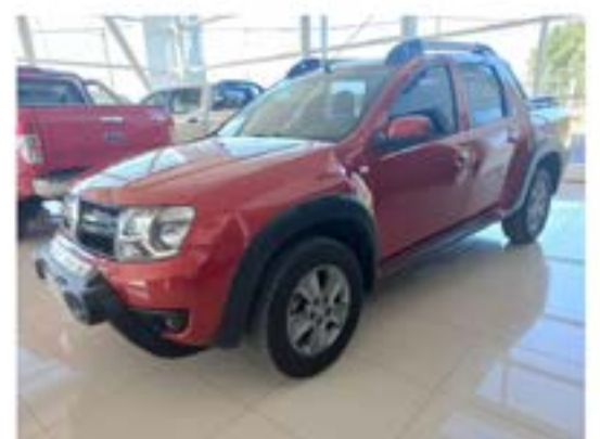
Duster Oroch 2.0 Outsider

Documentacion 100% Verificada - Usado con garantia - Tomamos tu usado en parte de pago