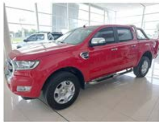
Ranger 3.2 Cd Xlt AT4x4