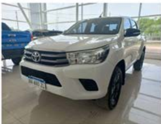
Toyota Hilux 2.8 Cd Sr 4x4