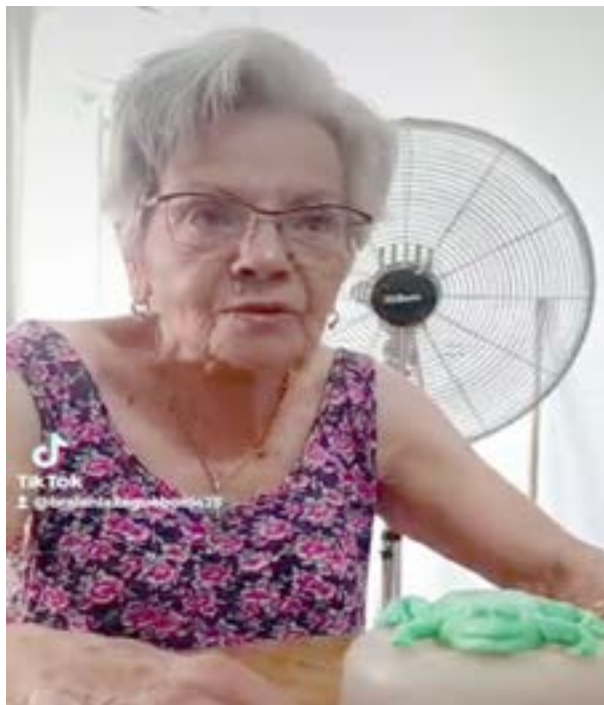
laboratorio de oficio, es la nueva tiktoker nuevejuliense