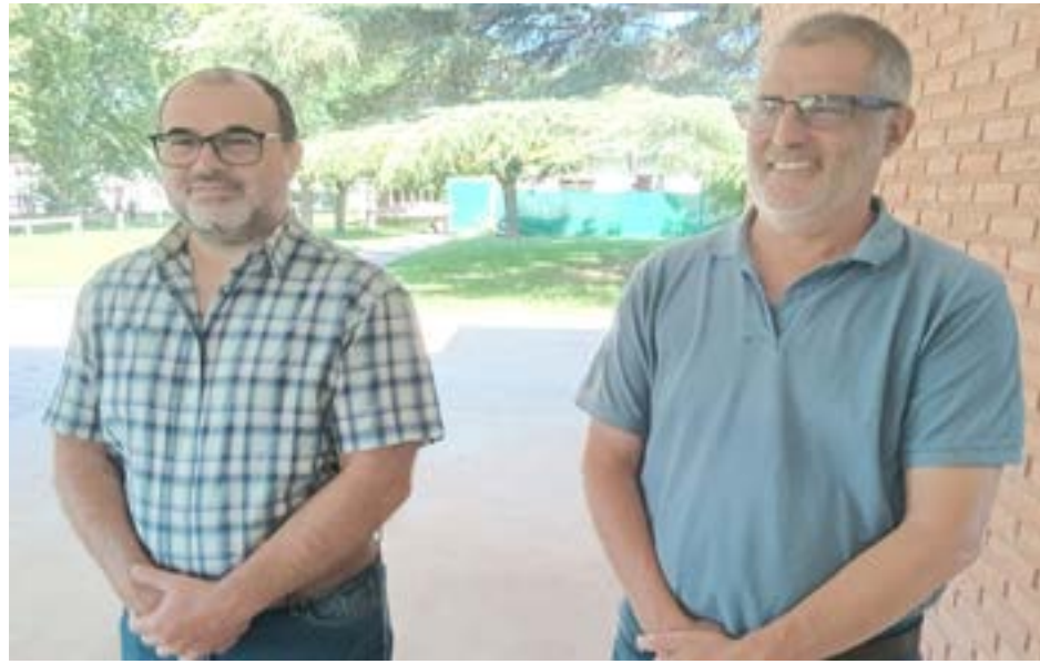
Los jóvenes al momento de ingresar a la Sociedad Rural para rendir su primer examen. A la derecha, los funcionarios provincial y municipal posando para la prensa de 9 de Julio.

Los exámenes teóricos a los aspirantes al ingreso al Comando de Prevención Rural (CPR) se realizaron ayer por la mañana en la Sociedad Rural. Los jóvenes que egresen serán incorporados a la fuerza no sólo de Nueve de Julio sino también de una amplia zona de la provincia