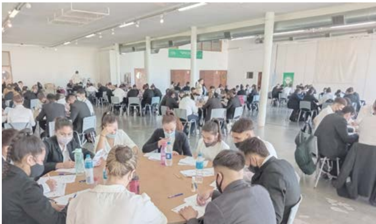
Jóvenes inscriptos para ingresar en el Comando de Patrulla Rural cumplen con uno de los exámenes de rigor.

INCAUTARON 15 MOTOS DURANTE EL FIN DE SEMANA