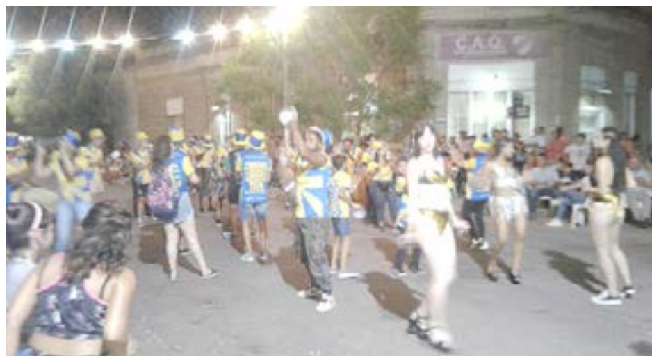
Ante un gran marco de público, en las noches del viernes y el sábado se desarrollaron en Facundo Quiroga los corsos organizados por el Club Atlético y el Departamento de fútbol infantil y juvenil, los que encontraron una masiva respuesta de la comunidad.