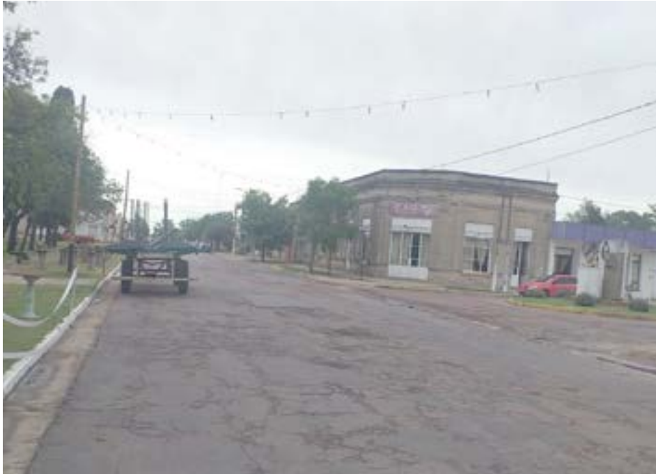
Vista de la calle San Juan

Ayer viernes fue la primera noche de los corsos de Facundo Quiroga y esta noche, a partir de las 21:30 será su segunda y última noche.