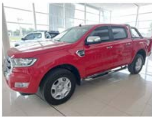
Ranger 3.2 Cd Xlt AT4x4