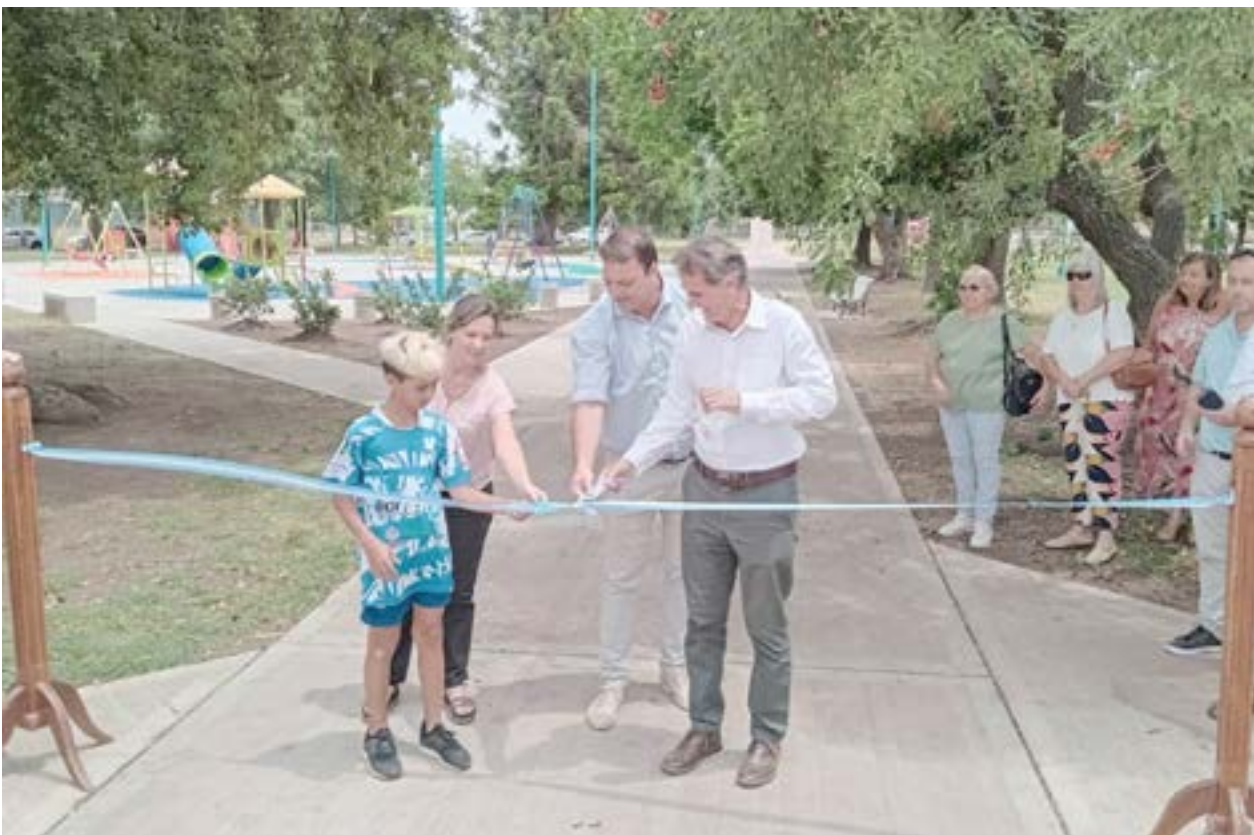
Preciso momento en que las autoridades proceden a realizar el tradicional corte de cintas en la s nuevas obras de Plaza Italia.