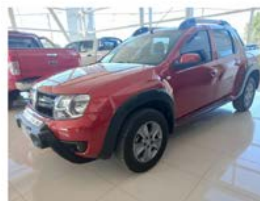
Duster Oroch 2.0 Outsider

Documentacion 100% Verificada - Usado con garantia - Tomamos tu usado en parte de pago