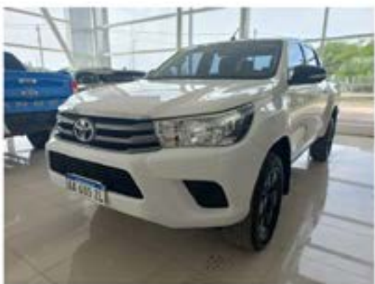
Toyota Hilux 2.8 Cd Sr 4x4