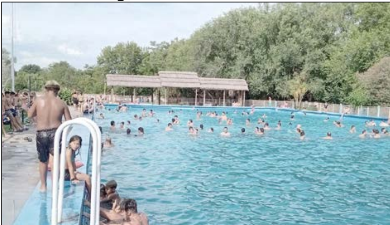
A pleno sol, Libertad desarrolló la Fiesta del Agua con números acuáticos, sorteos y shows en vivo de artistas locales.