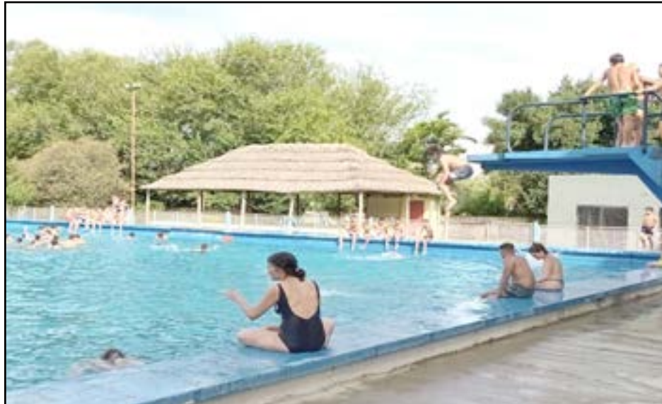
El evento al aire libre se desarrolló tal cual se había anunciado anteriormente.