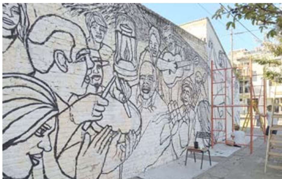
La imagen muestra el avance que lleva realizado el mural de Las Nazarenas.

"El mensaje tiene que ser sencillo y tiene que resaltar en él lo que es Las Nazarenas: una peña folklórica", finalizó Correa.