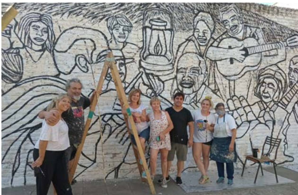
En un parate de su trabajo, los artistas locales posan para nuestro fotógrafo.