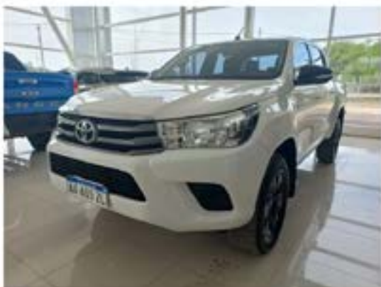
Toyota Hilux 2.8 Cd Sr 4x4