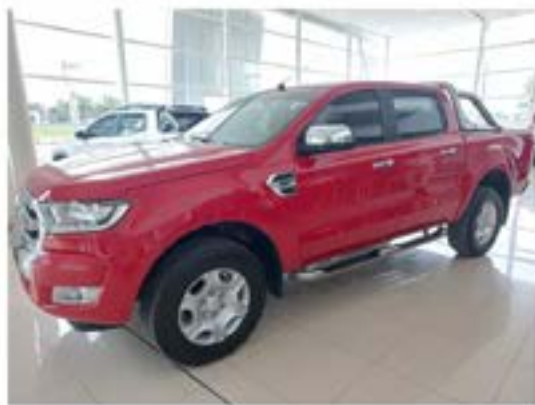
Ranger 3.2 Cd Xlt AT4x4