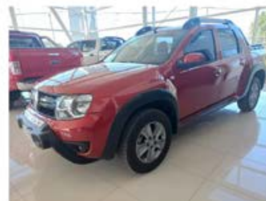
Duster Oroch 2.0 Outsider

Documentacion 100% Verificada - Usado con garantia - Tomamos tu usado en parte de pago