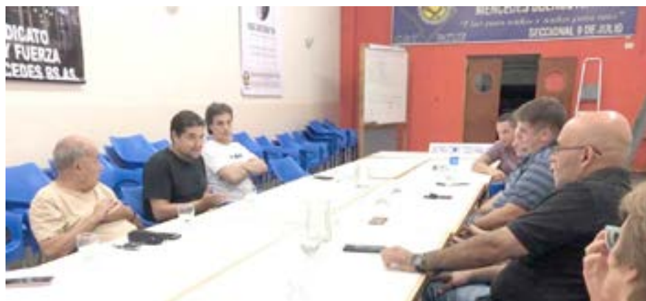
en el intercambio de ideas donde se enriquecen los programas y los proyectos" expresaron desde el bloque Juntos UCR.

"Es muy importante mantener el diálogo ya que es en el intercambio de ideas donde se enriquecen los programas y los proyectos" expresaron desde el bloque Juntos UCR.