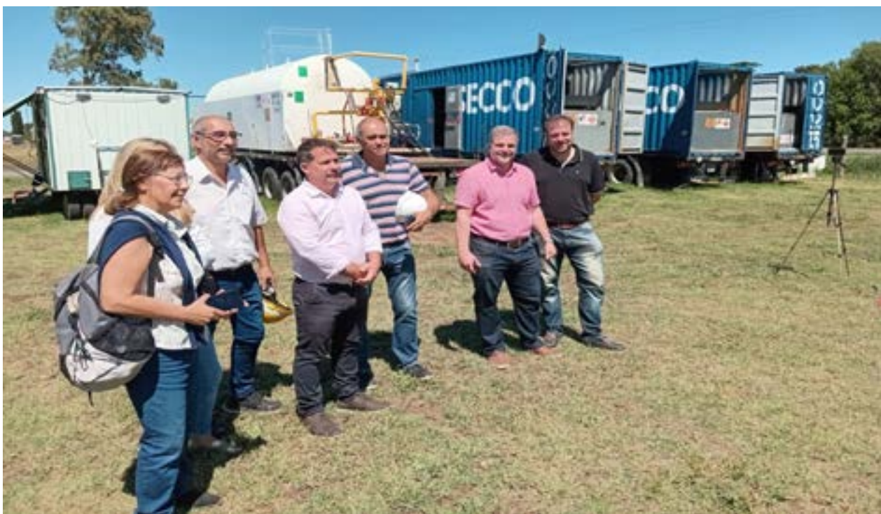
En rueda de prensa, se presentaron los tres nuevos generadores de energía con los que se suman diez en totalidad para alivianar temporalmente la situación eléctrica de la ciudad