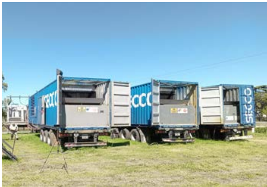
Vista de los tres nuevos generadores ubicados en la Ruta 5 en un predio de la empresa NUTRAL MIX (Foto De Sogos).

cubrir la necesidad que hoy tiene la ciudad". "9 de Julio tiene una capacidad instalada de transformación de 20 mva. En la estación transformadora de Urquiza y Agustín Alvarez; sumándose otros 10 mva. los transformadores que se encuentran en el Obrador cooperativo, 2 mva. los que se encuentran en el predio de Hilcor; y ahora otros 4 ma. con estos nuevos transformadores", detalló. Por su parte el responsable del servicio eléctrico de la CEyS, Marcelo Mango, consideró que esta alternativa "es fundamental para cubrir las necesidades que se van presentando en días de alta temperatura y hasta que se