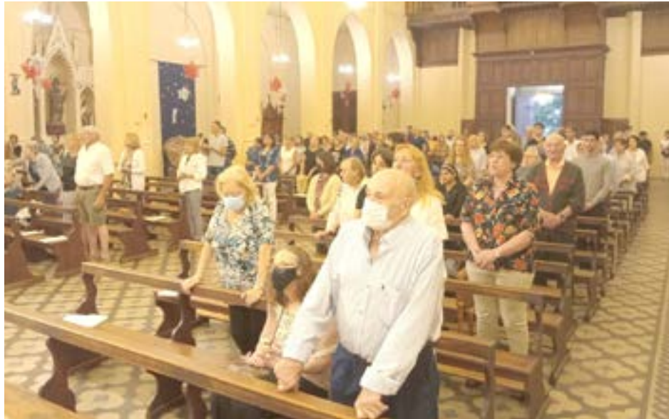
Parte de los fieles que asistieron a la Misa de Año Nuevo realizada el día domingo en la Iglesia Catedral.