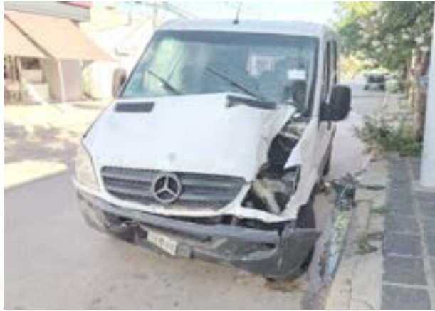
Imágenes del Honda Sedán, la Mercedes Benz Sprinter y el Renault Sandero, los tres vehículos involucrados en el violento accidente en pleno centro el 1 de enero.