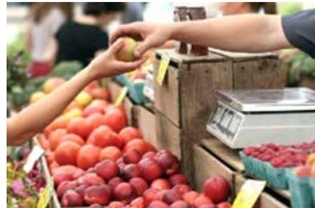
los locales mercantiles establecidos.

Es preciso mencionar que, la venta directa es la comercialización de bienes de consumo directamente a los compradores en sus hogares, lugar de trabajo o domicilio de otras personas y se caracteriza por realizarse fuera de