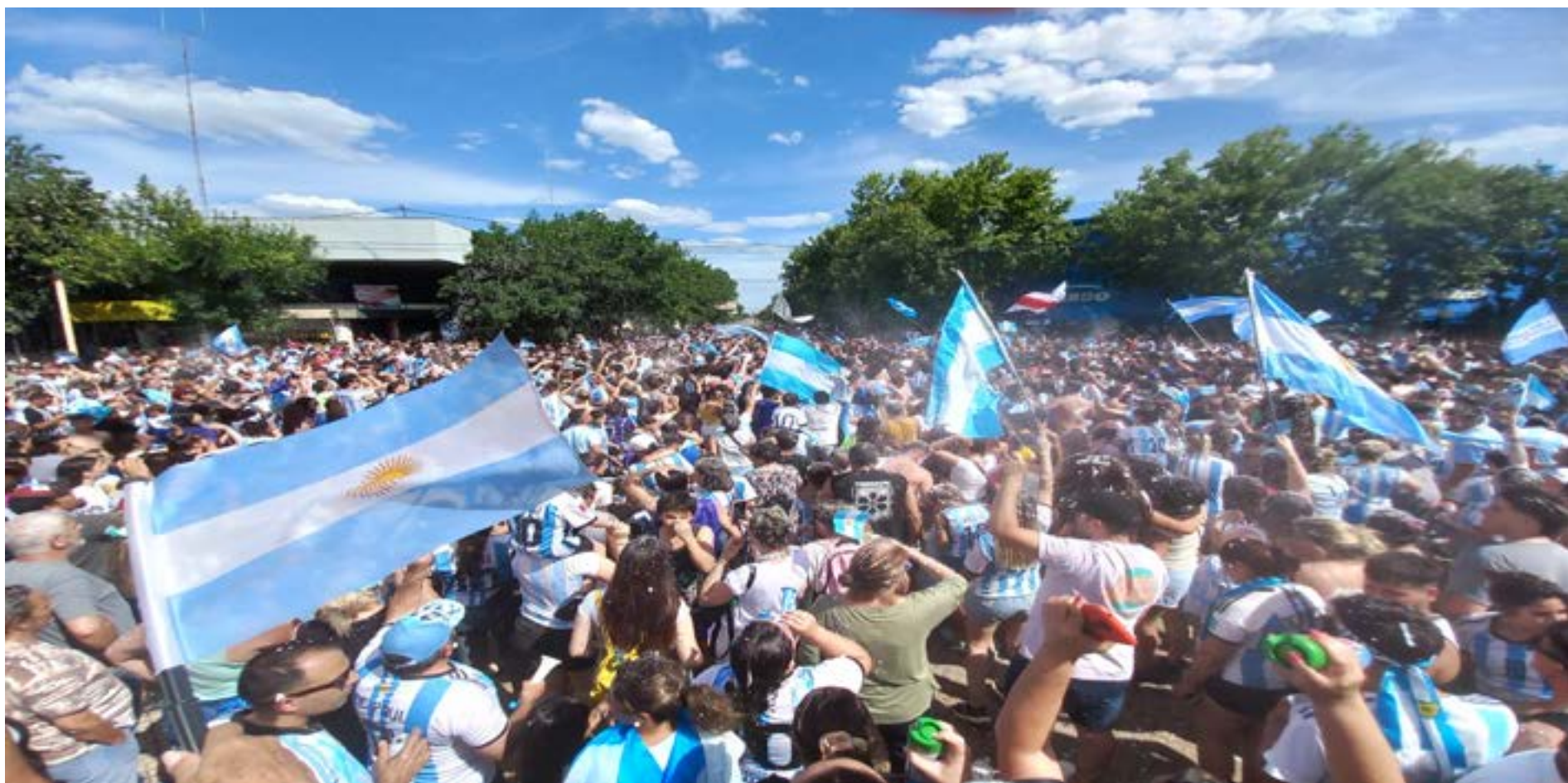
Todo Celeste y Blanco: la comunidad de 9 de Julio festejó la tercera Copa del Mundo de Fútbol ganada por la Selección Argentina