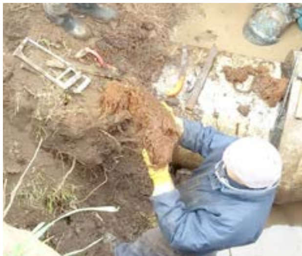
ABSA informa que a partir del próximo miércoles 21, se realizarán importantes tareas de mantenimiento sobre el

acueducto que une las ciudades de 9 de Julio de Julio, Carlos Casares y Pehuajó, todas ellas orientadas a la extracción de raíces que afectan la funcionalidad de la cañería. Los trabajos fueron programados luego de constantes monitoreos que determinaron una importante afectación de la capacidad de transporte, ocasionado por la intrusión de raíces de pinos presentes en el paisaje de la traza. Si bien en el último tiempo se han realizado más de 500 reparaciones a lo largo del conducto emplazado sobre la Ruta Nacional 5, estas tareas de mantenimiento son propias