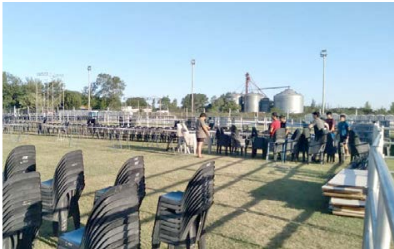
Ultiman los preparativos para el gran mega evento de hoy sábado en el Club Libertad.