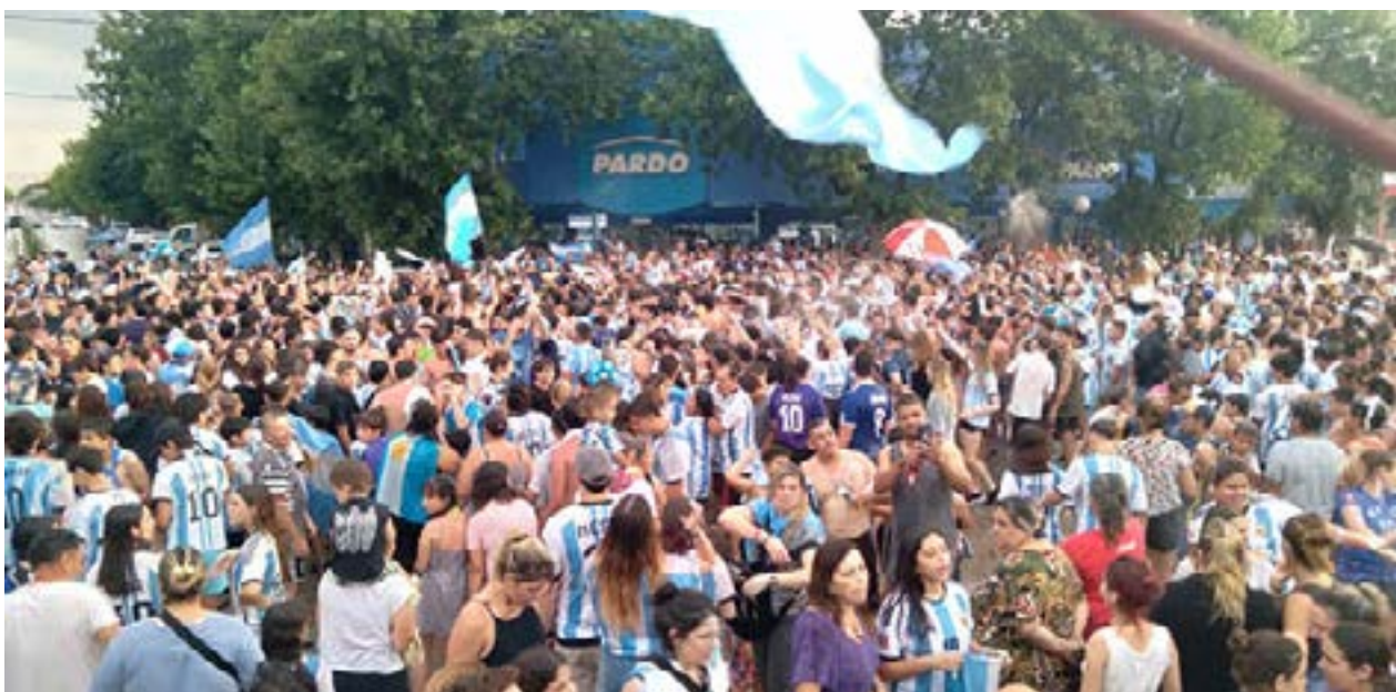
Mucho colorido y alegría en el centro de la ciudad.

"NI UN PIBE NI UNA PIBA MENOS POR LA DROGA"