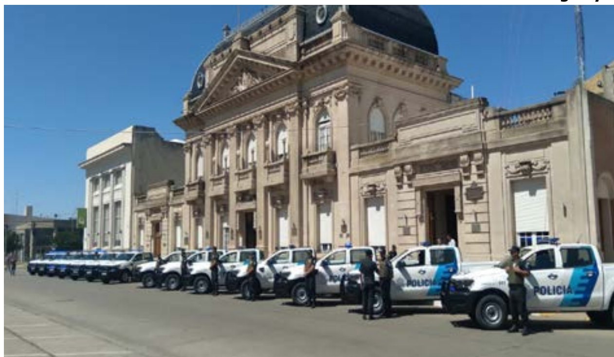
La imagen muestra los patrulleros entregados en 9 de Julio ayer a la mañana.

EN LA ESCUELA DE EDUCACIÓN SECUNDARIA TÉCNICA N° 2