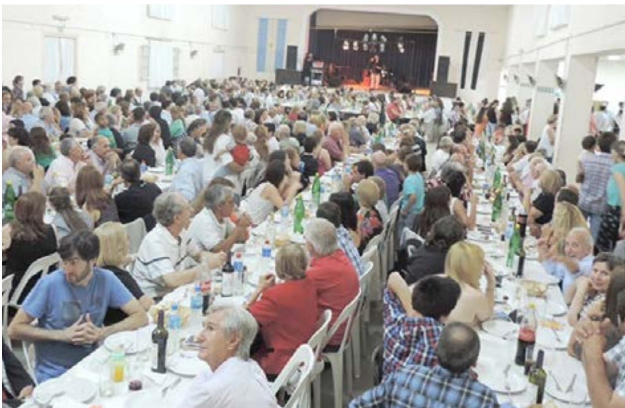
Imagen de una de las últimas fiestas multitudinarias de French.