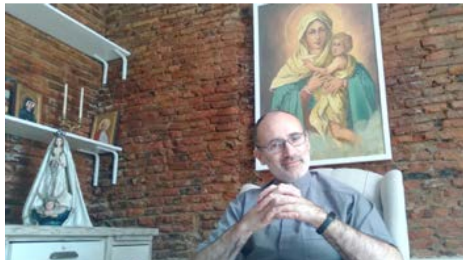
El cura párroco de Nueve de Julio permanecerá en nuestra ciudad hasta el 14 de noviembre, fecha en que luego continuará su misión pastoral en Lincoln.

“Soy paisano de dos tiempos y, por ende, necesito un tiempo para hacer alguna reflexión sobre mi desempeño en 9 de Julio, el que ha sido muy intenso y se puede resumir en tres puntos fundamentales, como son un gran primer momento dado