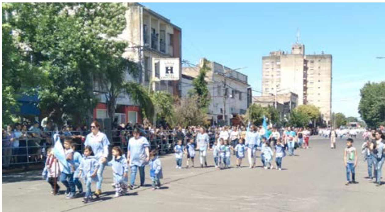
Establecimientos educativos de todos los niveles se sumaron al festejo del aniversario de la ciudad.