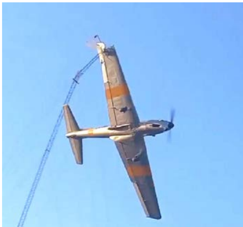
Preciso momento en que el ala derecha de la aeronave golpea la antena.