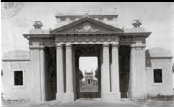
Antigua imagen del cementerio municipal local

areneros con juegos para niños, sistema de riego, y se arregló el ámbito del monumento y el mástil. El 25 de mayo de 1996, se inauguró el mástil para que flameara la bandera española junto a la enseña nacional.