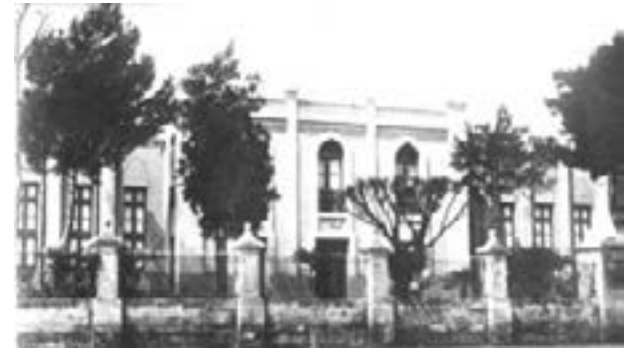
Antiguo edificio de lo que hoy es el hospital Julio de Vedia