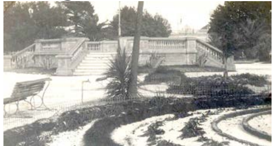
La "Rotonda", una construcción, a manera de escenario, que se alzaba en el centro de la Plaza «General Belgrano», en el mismo lugar donde hoy se encuentra la fuente.

La plaza fue diseñada por el agrimensor Miguel Vascheti, quien destinó para ella dos manzanas indivisibles, rodeadas por avenidas y calles con trazado cuadrangular, algo establecido por ley en la fundación de ciudades por el gobierno español.