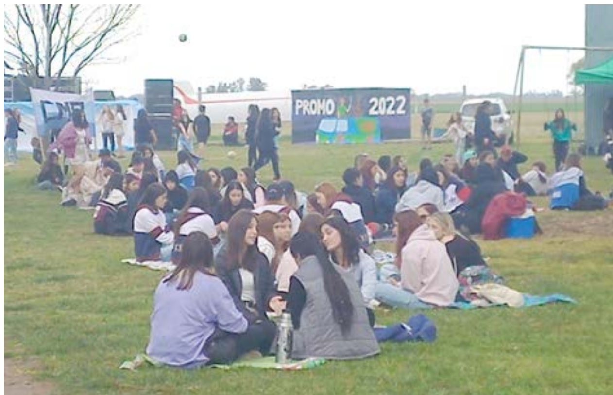
Los estudiantes festejaron el tradicional picnic de la Primavera en las instalaciones del Aeroclub durante la jornada de ayer.