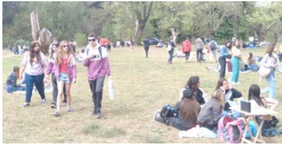
Mucho colorido, alegría, música y entusiasmo en el Aero Club. Los estudiantes celebraron su día.

Como todos los años, al celebrarse ayer el Día del Estudiante y el Día de la Primavera, los jóvenes celebraron ambas fechas con el tradicional picnic en el