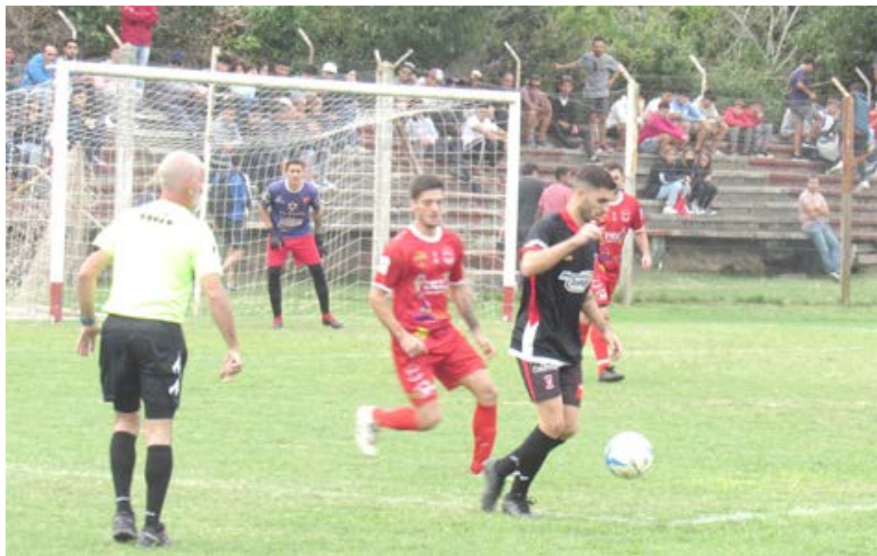
Mañana domingo arranca el torneo local 2022 de la Liga Nuevejuliense de Fútbol.