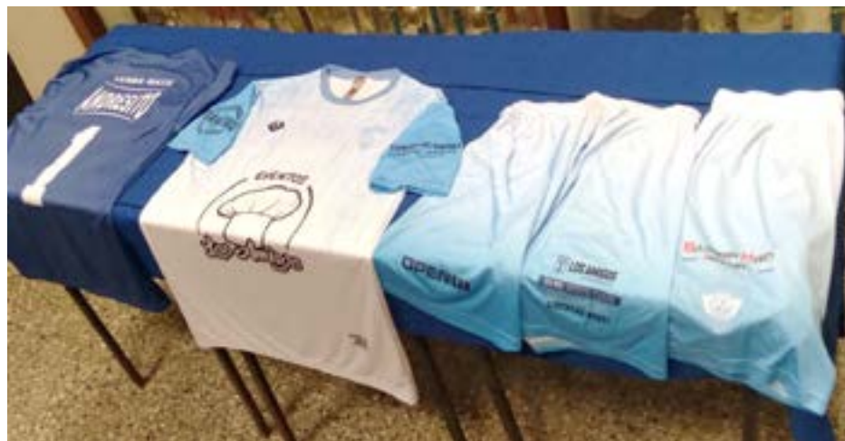
Autoridades del club, cuerpo técnico y jugadores, presentaron la nueva indumentaria "santa".