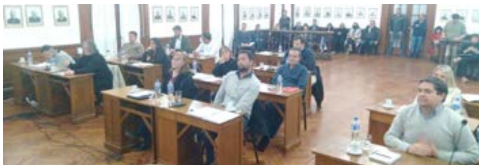
Concejales que participaron de la doble sesión del HCD el pasado jueves.

El Concejo Deliberante de 9 de Julio se sumó al listado de distritos de la Cuarta Sección Electoral que debatieron sobre el atentado a la Vicepresidenta de la Nación, Cristina Fernández de Kirchner, quien fue atacada con un arma de fuego