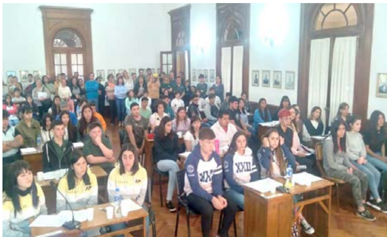
Estudiantes de todo el distrito de Nueve de Julio participaron ayer por la tarde con distintos proyectos sobre planta urbana y las localidades.